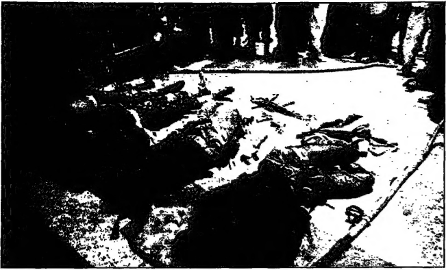
جند فرنسيون في الجزائر امام الصحافيين وهم لاصحاب المجموعة المسلحة التي اشككت الاثني عشر لثلاثا من قوات خاصة من الجيش طيلة شهرين سامة يحيى مسؤولين في مطار الجزائر الدولي واجتمع بعضهم جميعا (مونتاج)

الجمهورية ونساء اخريات امام محكمة جنائيات العاصمة وتفاصيل جديدة عن عملية حي باب الزوار التي ان هذه العملية اشككت الاثني عشر لثلاثا من قوات خاصة من الجيش طيلة شهرين سامة يحيى مسؤولين في مطار الجزائر الدولي واجتمع بعضهم جميعا (مونتاج)